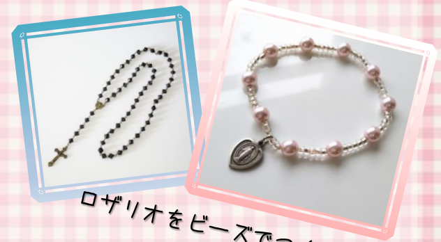
ロザリオをビーズでつくるよ♪